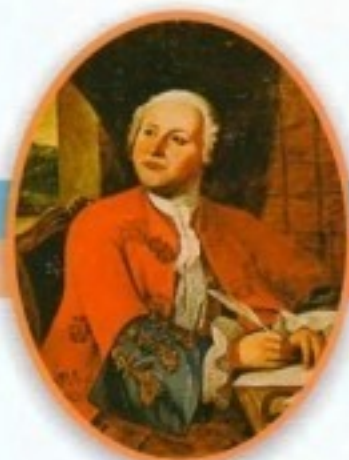
Михаил Васильевич Ломоносов Великий русский ученый

Ты, конечно же, вспомнишь, что Александр Сергеевич Пушкин написал много прекрасных стихов и чудесные сказки: «Сказка о царе Салтане», «Сказка о рыбаке и рыбке», «Сказка о мертвой царевне и о семи богатырях», «Сказка о золотом петушке». Петр Ильич Чайковский писал необыкновенно красивую музыку, создал цикл пьес «Времена года» и хорошо знакомый тебе «Детский альбом». Михаил Васильевич Ломоносов — великий русский ученый, он многого добился в самых разных областях знаний: литературе и искусстве, физике и астрономии, географии и истории. Им сделано много важных научных открытий. Юрий Алексеевич Гагарин был первым космонавтом, первым человеком, облетевшим на космическом корабле «Восток-1» нашу планету.