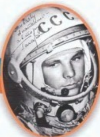
Юрий Алексеевич Гагарин Первый космонавт