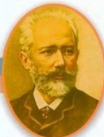
Петр Ильич Чайковский Великий русский композитор