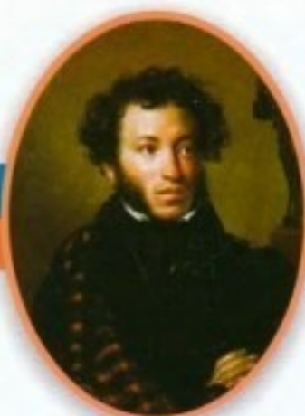
Александр Сергеевич Пушкин Великий русский поэт